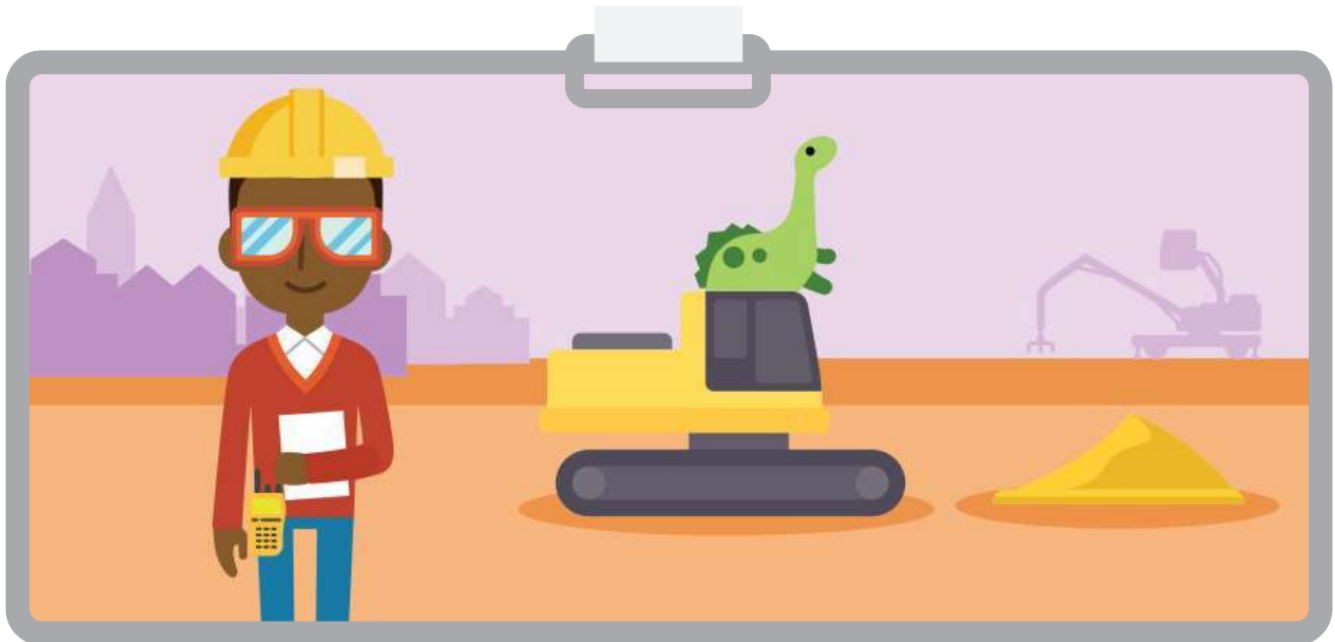
Illustration de l'élève n° 1 :

Illustre un professionnel en milieu de travail et décris certaines caractéristiques de sa profession.